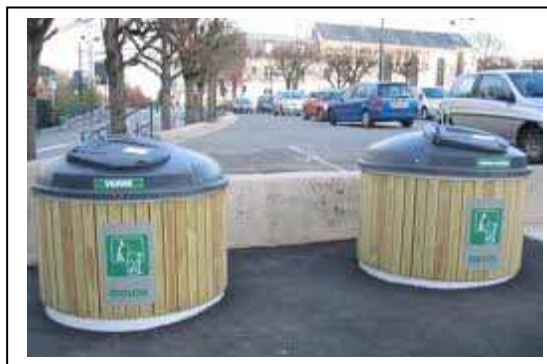
Colonnes semi enterrées

La commission va lancer une étude sur la possibilité d'implantation sur notre secteur.